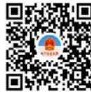
用微信扫一扫，使用小程序

(3) 在百度APP中输入“电子营业执照”搜索安装百度版“电子营业执照”小程序，或者用百度APP扫“百度电子营业执照二维码”安装百度版“电子营业执照”小程序。