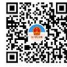
用百度APP扫一扫，进入小程序

(3) 安卓手机在手机自带的“应用市场”或“腾讯应用宝”中输入“电子营业执照”搜索安装APP，或者用手机浏览器扫“安卓版电子营业执照二维码”，安装安卓版“电子营业执照”APP。