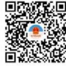
用支付宝扫一扫，进入小程序